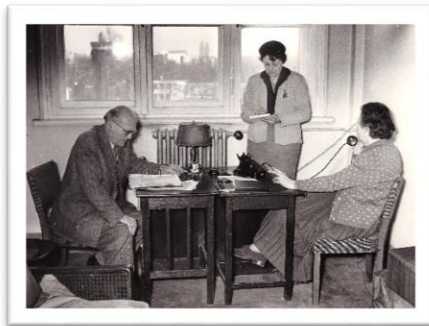
1956 in Berlin Charlottenburg